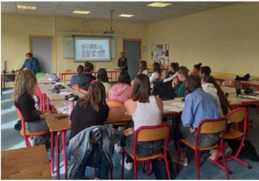
Concours Koad'9 : participation de la classe à la remise des prix en visioconférence